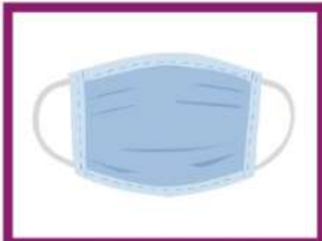
PORTER UN MASQUE DANS LES ESPACES EN COMMUN