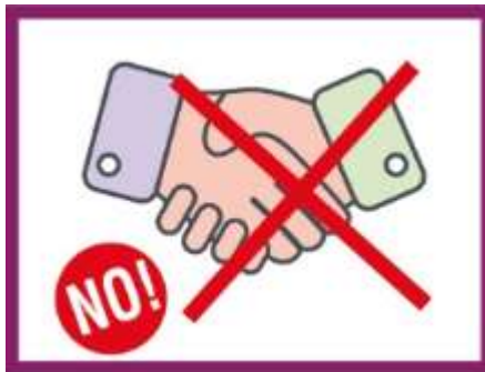
EVITER DE SERRER LA MAIN