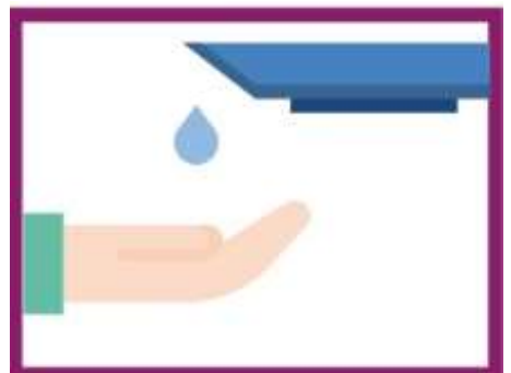
SE LAVER REGULIEREMENT LES MAINS