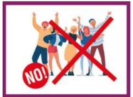
EVITER LES REGROUPEMENTS DE PERSONNES

Suivez les règles et protégez-vous et protégez les autres!