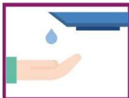
LAVARSI SPESSO LE MANI