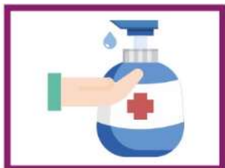
USARE GEL IGIENIZZANTE