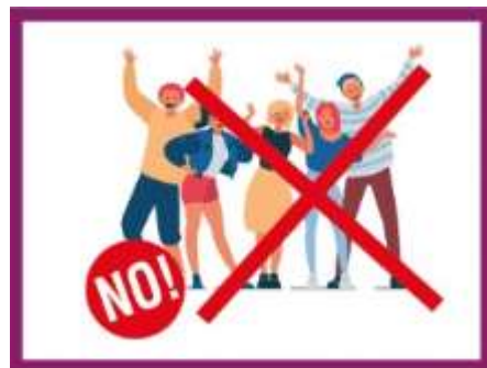
EVITARE GLI ASSEMBRAMENTI

segui le regole e proteggiti te stesso e gli altri