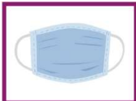
INDOSSARE LA MASCHERINA NEGLI SPAZI COMUNI